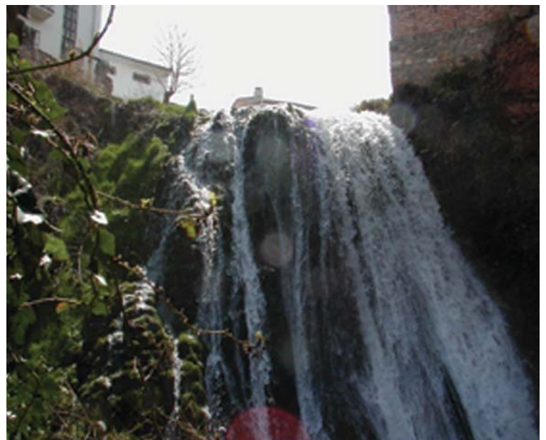
La Chorrera del Milla