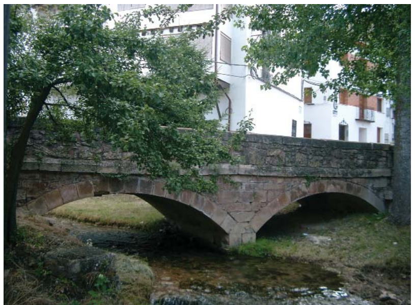
El puente de la Plaza desde la Chorrera de El Cano