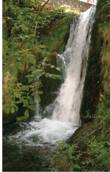
La Chorrera de la Plaza.