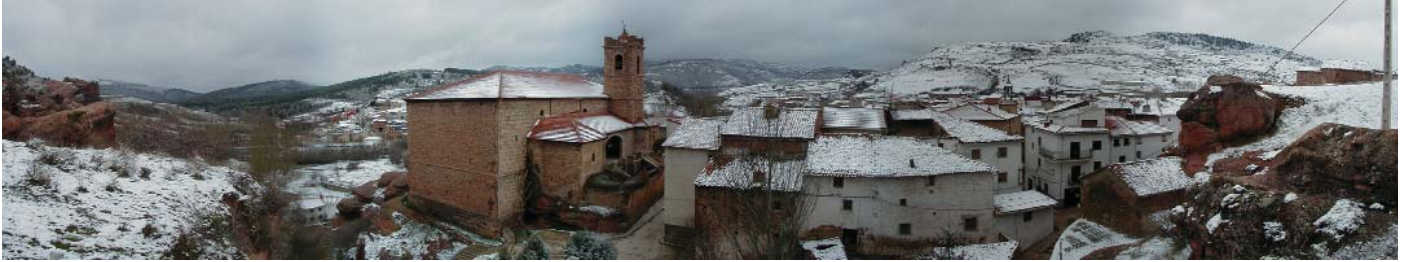
La nieve, fuente de agua. Panorámica de Checa nevada.

En esta entrega las fotografías de Victoriano nos llevan por el río Genitores, desde el nacimiento en la Aguaspeña hasta la Chorrera del Milla.