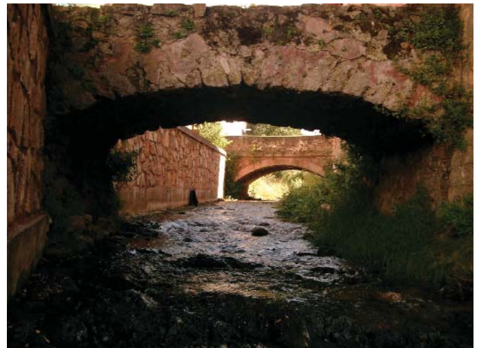
Los puentes de la calle Baja del Río.