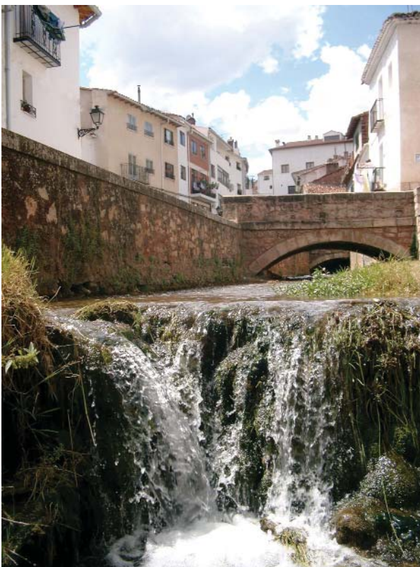
Puentes del Solanillo