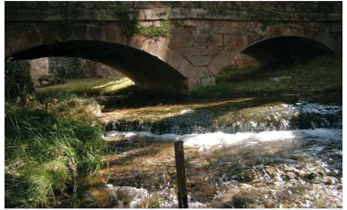
El puente de la Plaza