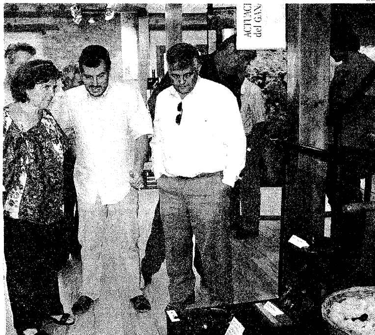
La consejera abrió ayer por vez primera el museo de Checa y recorrió sus diferentes estancias.

ponsable de las políticas de Medio Ambiente del Gobierno regional señaló que "el éxito de estos centros de interpretación radica en los valores que prioriza la sociedad moderna y progresista que habita hoy la región en Castilla-La Mancha. Una sociedad sensible con el Medio Ambiente y que apuesta por las políticas de desarrollo sostenible que defiende el Gobierno del presidente Barreda", explicó la consejera, que abrió un nuevo espacio museístico sólo tres meses después de que se hiciese lo propio con el centro de interpretación del Río Tajo en Zaorejas.